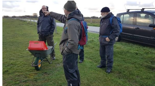
goed voorbereid op pad

Rij 9: 20 vallen AC 51772-425013 tot 51837-425082