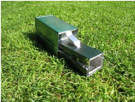
Inloopval of lifetrap

De werkwijze van de Zoogdierwerkgroep van de KNNV is als volgt: Er wordt gebruik gemaakt van Longworth inloopvallen, zogenaamde lifetraps. Dit type val bestaat uit een tunneltje met een valdeurtje en een leefruimte.