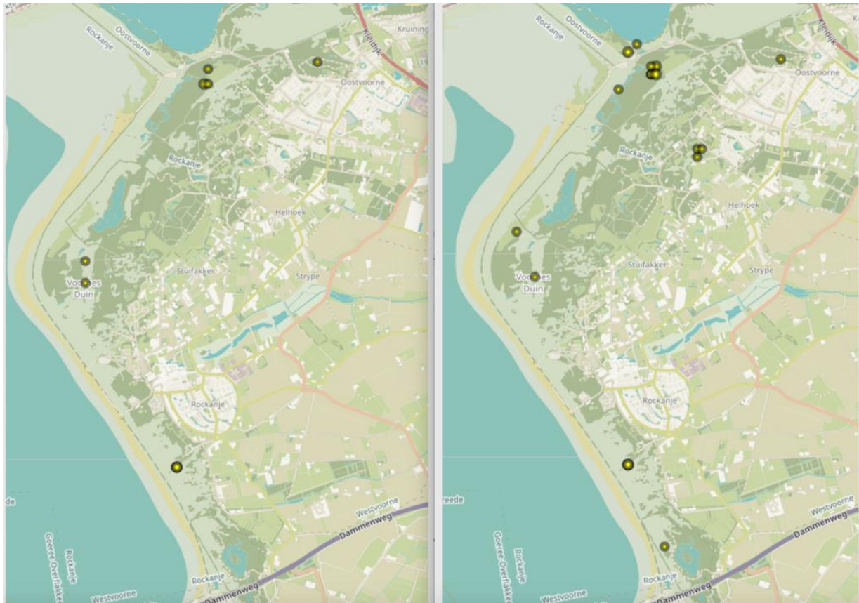
Links: locaties waarnemingen grote boterbloem 2008 t/m 2014; rechts 2015 t/m juli 2022

Op de kaarten en in de tabel is goed te zien dat er meer waarnemingen van grote boterbloem zijn gedaan, op meer locaties en in meer deelgebieden. Een verdubbeling als we de twee periodes vergelijken. Hoe is dit te verklaren?