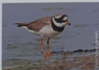
BONTBEKPLEVIER (18-20 CM)