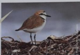
STRANDPLEVIER (15-17 CM)