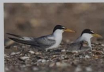
DWERGSTERN (22-28 CM)