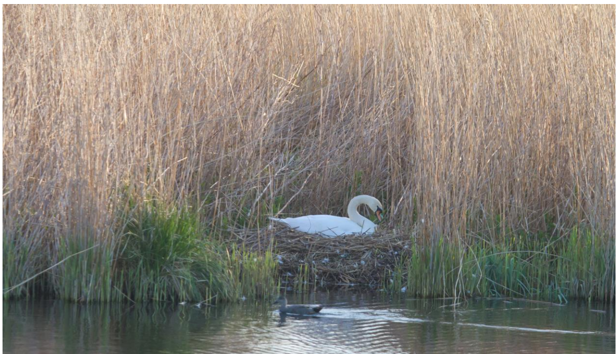
Broedende zwaan in het rietgedeelte.