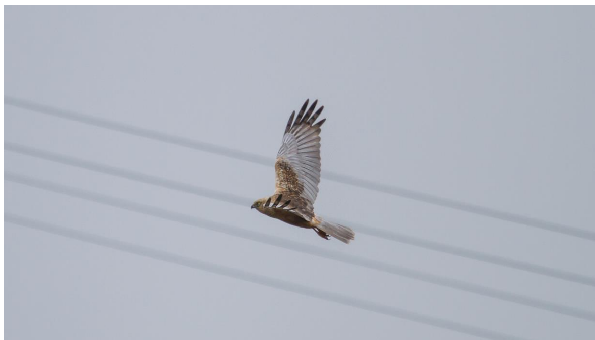
Bruine kiekendief was na jaren van afwezigheid ook weer als broedgeval te noteren.