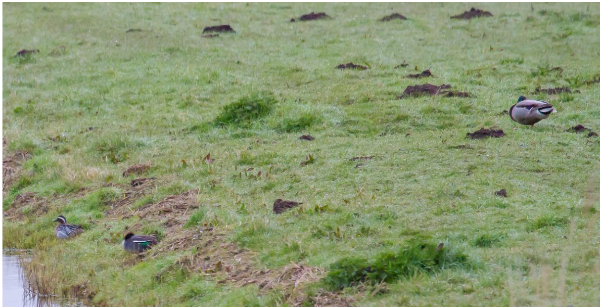
Zomertaling, wintertaling en wilde eend