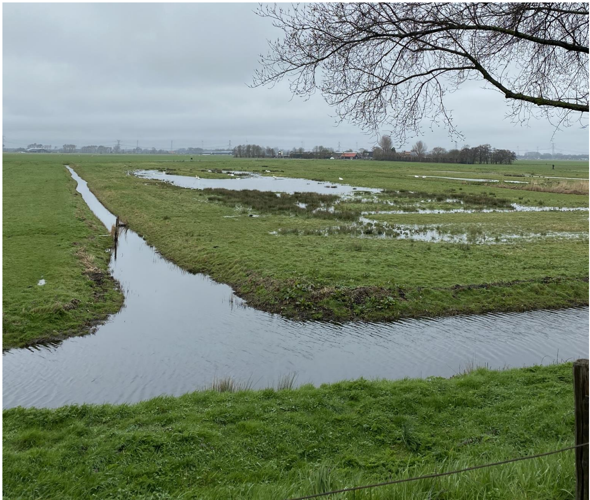
Het natte deel van de Waalhoek heeft veel aantrekkingskracht op watervogels.

Het is aan te bevelen om het vernatten van het gebied vol te houden en eventueel uit te breiden naar andere delen zodat jonge vogels meer foerageergebied hebben.