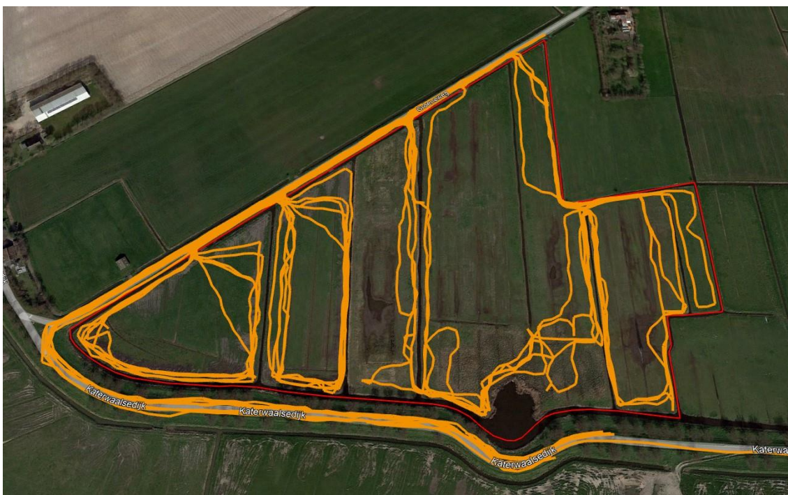
De gelopen tracks over elkaar heen gelegd.