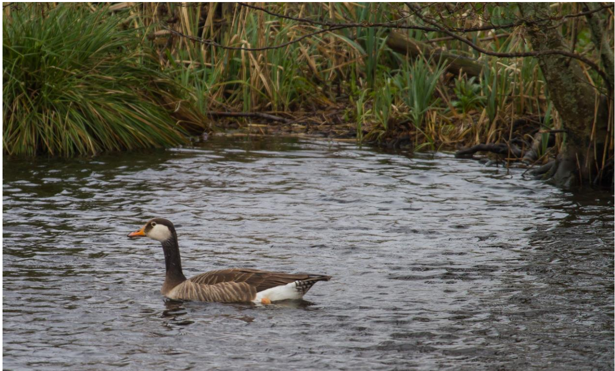
Hybride grote canadese gans/grauwe gans