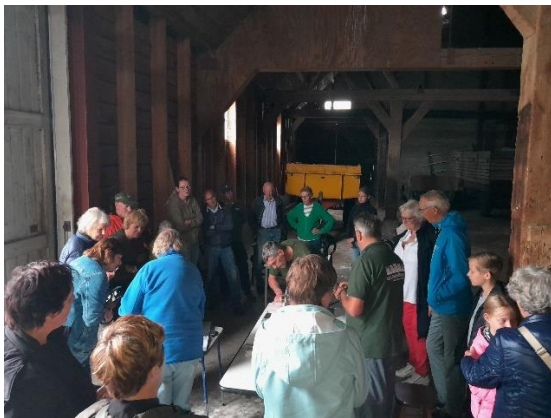
Het enthousiaste publiek

De kerkuilwerkgroep krijgt soms hulp bij haar activiteiten, zo kregen we dit jaar weer voorgezaagd hout voor een aantal kasten van de provinciale kerkuilwerkgroep. Daarnaast helpen boeren af en toe ook een handje mee door hun hoogwerker in te zetten bij kastcontroles. Boeren zijn sowieso erg positief en behulpzaam. We voelen ons altijd zeer welkom!