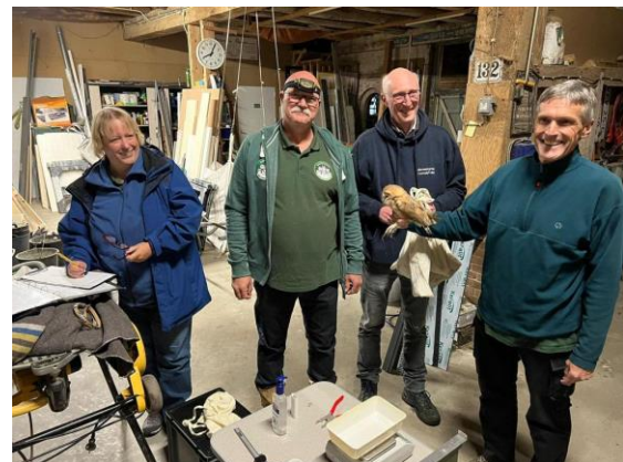
en een deel van de enthousiaste werkgroepleden .....