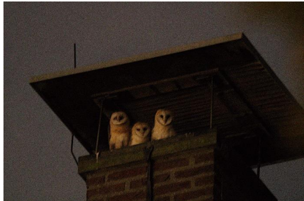
Aantal geringde jongen sinds de oprichting van de kerkuilwerkgroep