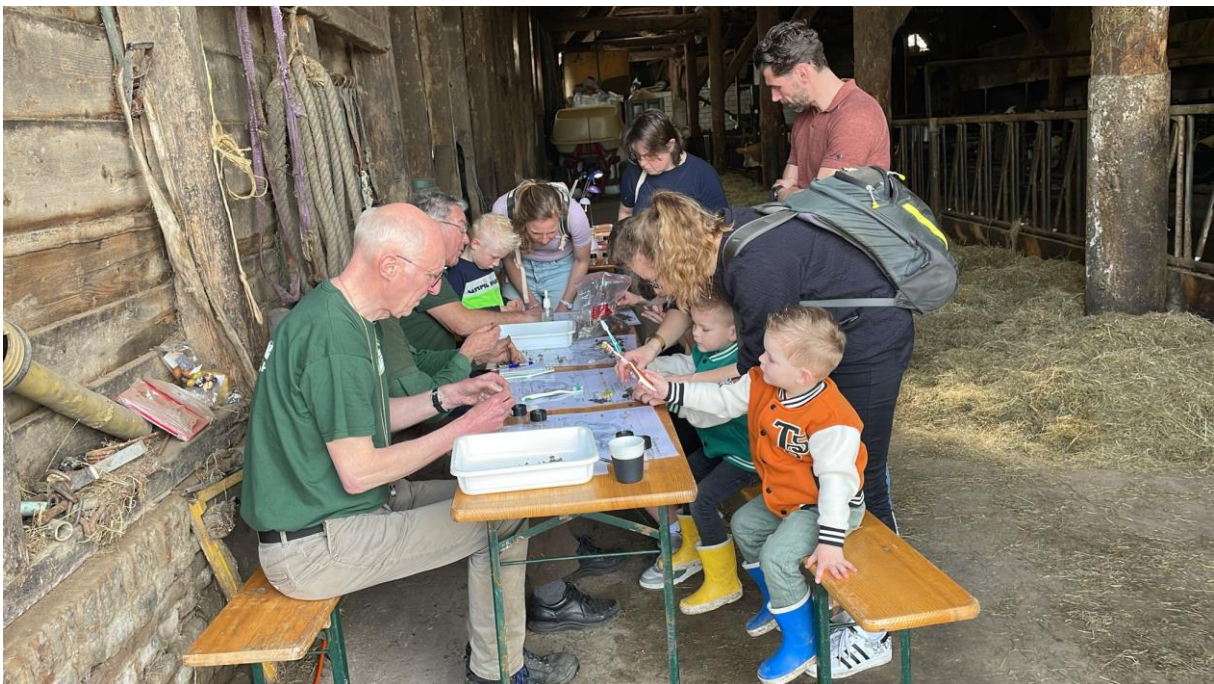
Braakballen pluizen tijdens “Kom in de kas” bij Boer Bergh terwijl de uilen boven je hoofd vliegen

De uilenwerkgroep Voorne-Putten is eind 2010 opgericht en bestaat uit een kleine groep actieve leden die locaties zoeken, kisten maken en ophangen, kisten controleren en schoonmaken en de uilen indien mogelijk ringen. Af en toe wordt deelgenomen aan evenementen georganiseerd door de agrarische sector zoals grote evenementen als Kom in de Kas en de Fokveedag maar ook aan kleinere zoals kinderactiviteiten op scholen en bezoekerscentrum Tenellaplas.