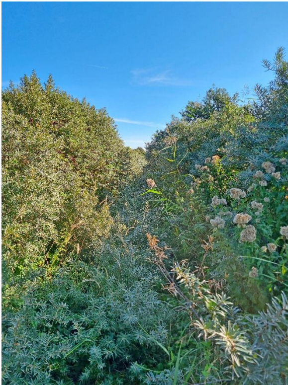
Het snel dichtgroeïende pad

Het telgebied bestaat uit een langgerekte strook bestaande uit een waterkerende dijk aan de noordzijde die inmiddels geheel dichtbegroeid is. Aan de voet van de dijk een smalle strook met bosschages en een enkele boom en met daaraan grenzend een schor, slikken en zandbanken/strand. Hier ontstaan jonge duintjes die deels met helmgras zijn begroeid. Het schor grenst aan een wadachtig gebied (Slikken van Voorne) en de zee.