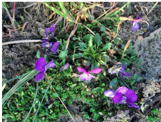
Koningskaars Duinviooltje